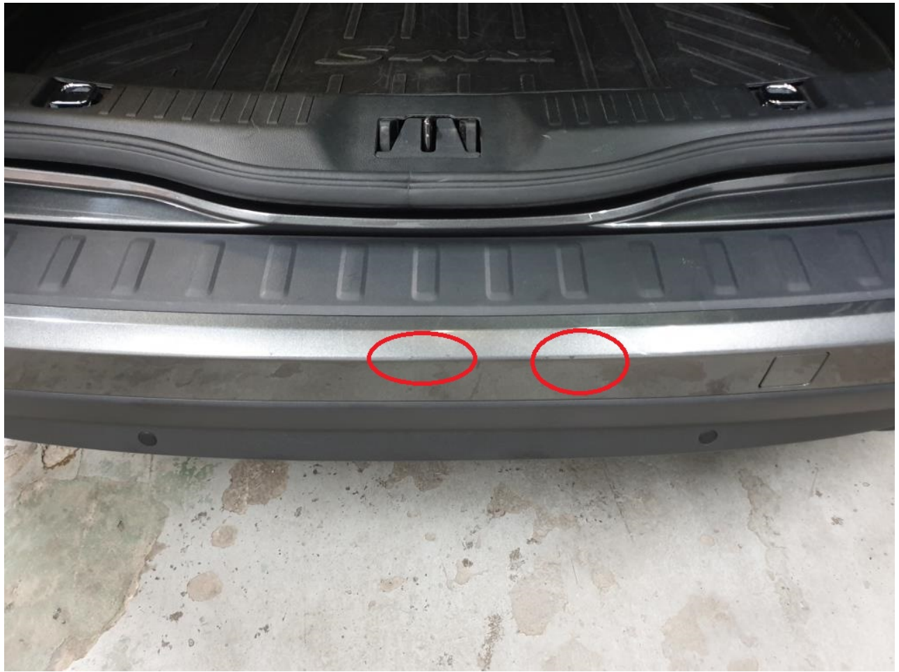
Stav před lakováním