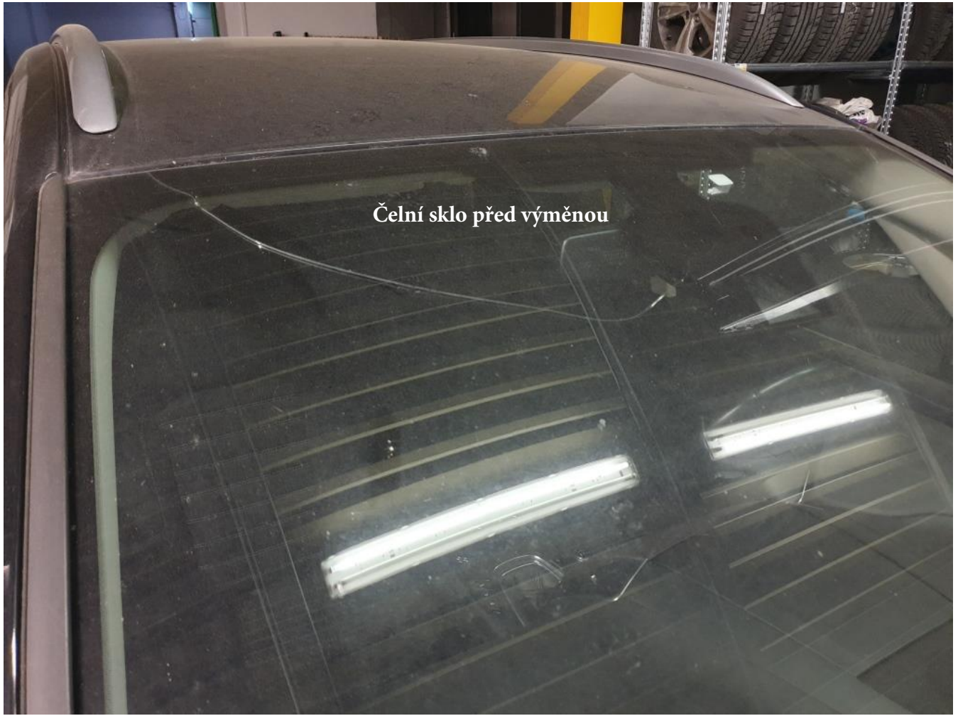
Čelní sklo před výměnou